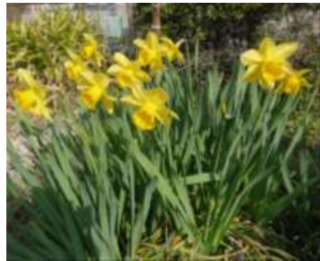
職員と一緒に屋上に上がって春を感じてみましょう！

園芸クラブより 気候も良くなってきましたね。屋上では今、水仙の花が綺麗に咲いています。