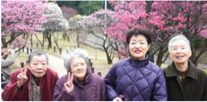
梅を観た後はおやつで一服。皆さん上機嫌で帰路につきました！