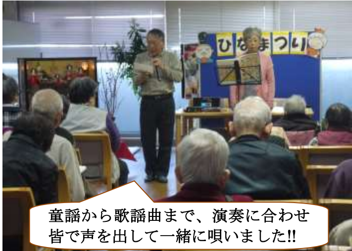
童謡から歌謡曲まで、演奏に合わせて皆で声を出して一緒に唄いました!!

ひなまつり会(地域交流) 3/3(土) 今年ハハーモニカ演奏のボランティアの方が来られ、心地良い演奏を披露して頂きました。